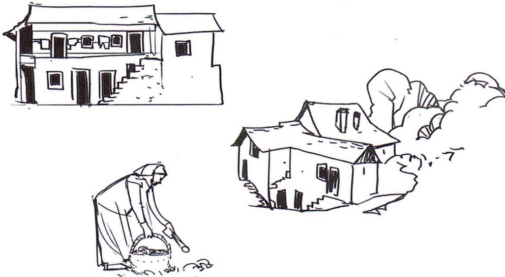
Les esquisses réalisées pour la maison tessinoise

Et l'on n'oubliera pas de retrouver la FAVJ qui, dans un article du 17 mai 2018, signé Joël Reymond, témoigne de cette réalisation.