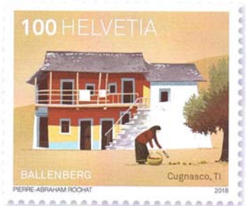
Maisons d'habitation, Cugnasco TI, env. 1740/1770/1860 Les maisons du Sopraceneri avaient ceci de particulier qu'on n'y trouvait pas de salle à manger. Toute la vie se déroulait dans la cuisine.