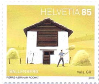
Grange à foin, Vals GR, env. 1780 La particularité de cette grange à foin située dans le hameau de Camp, près de Vals, réside dans ses piliers angulaires massifs.