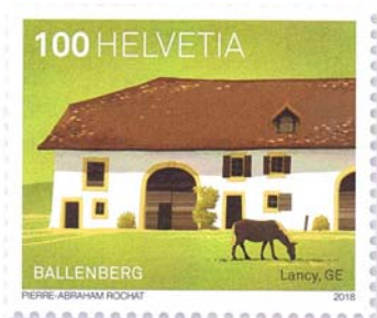
Ferme avec pigeonnier, Lancy GE, 1762/1796/1820 Ce bâtiment, qui connut plusieurs agrandissements, fut flanqué en 1796 d'un pigeonnier... pour enrichir la carte des mets.

Commander avec bulletin de commande ou sur postshop.ch