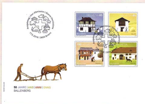
Série sur enveloppe du jour d'émission C6