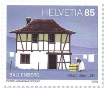
Lavoir, Rüslikon ZH, 1750–1800 Cette élégante maison à colombages a connu plusieurs usages différents au fil du temps. Vers 1900, elle servait notamment de buanderie.